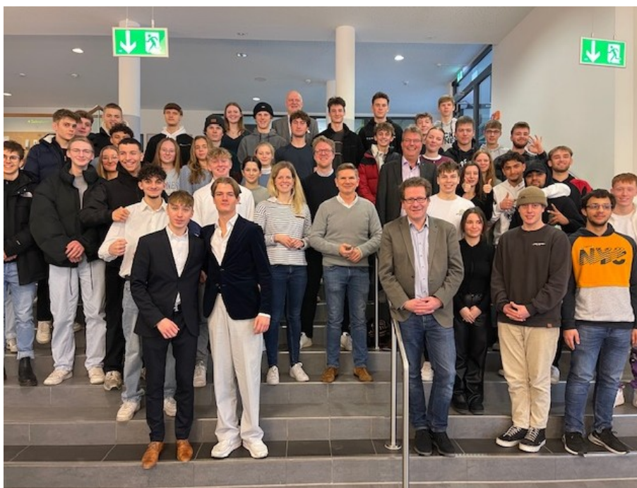
Bild 3: Die fünf Abgeordneten, umgeben von den Schülerinnen und Schülern.