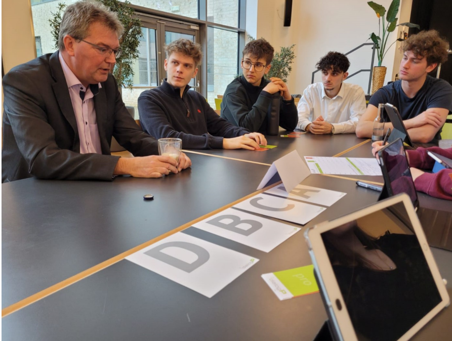
Bild 2: Der Abgeordnete des SSW, Lars Harms, im Gespräch mit einigen Schülern.